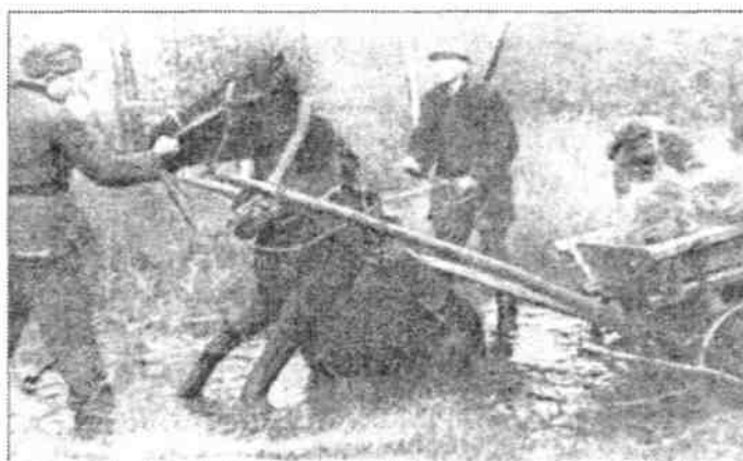
Октябрь 1943 г.