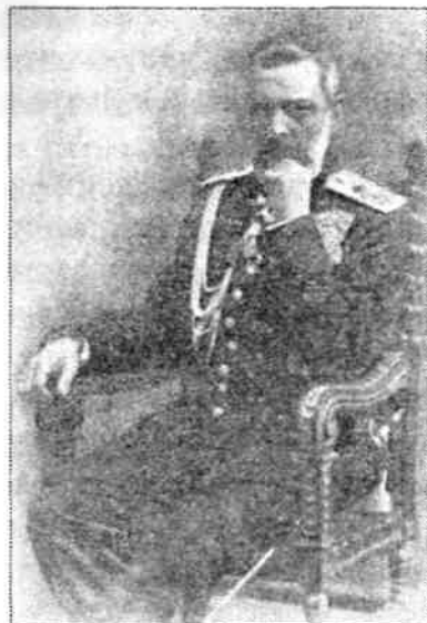
Романов Владимир Александрович

артиллерийская бригада – в Гатчино и 24-я артиллерийская бригада – в Луге. В XIX в. в Петербургском военном округе для воинских частей существовал только один летний лагерь под Красным Селом. В 1881 г. император Александр III назначил командующим войсками гвардии и Петербургского военного округа своего брата великого князя Владимира Александровича Романова (1847-1909), который обладал неоспоримым авторитетом в обществе и как президент Академии художеств был просвещенным покровителем всех отраслей искусства. Именно Владимиру Алек-