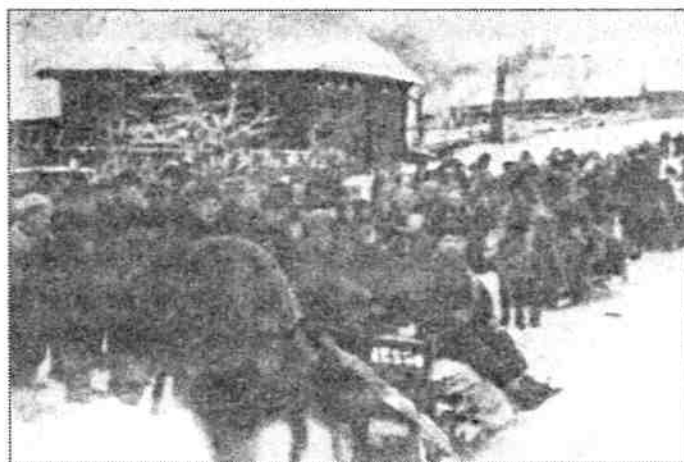
В один из полков прибыл обоз с лыжами и другим имуществом из партизанских мастерских. Деревня Лазуни. Январь 1944 г.