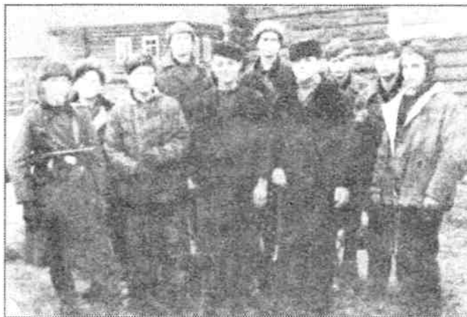
Молодое пополнение. Деревня Лазуни. Осень 1943 г.