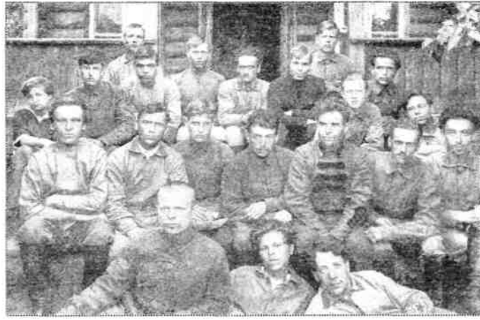
На учебных сборах. 1923 год.

Лагерь были повешены 6 человек. В начале ноября 1919 г. бронелетучка псковских железнодорожников выбила балаховцев со станции Струги-Белая, где они базировались.