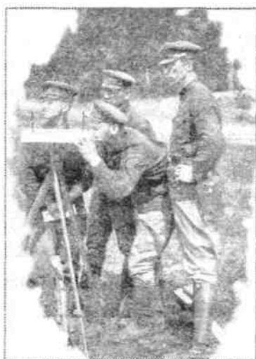
Съёмка местности. 1936 год.

В конце 1930-х гг. в летние лагеря «Струги Красные» на сборы прибывала 1-я легкотанковая бригада (ранее – 19-я механизированная бригада ЛВО). 9 июня 1940 г. командование ЛенВО приняло решение сформировать 1-й механизированный корпус. Его создание завершилось в октябре 1940 г. Управление корпуса формировалось на базе управления 20-й тяжелой танковой бригады имени С. М. Кирова в лагере Череха под Псковом. В составе 1-го мехкорпуса в летних лагерях «Струги Красные» на базе 1-й легкотанковой бригады