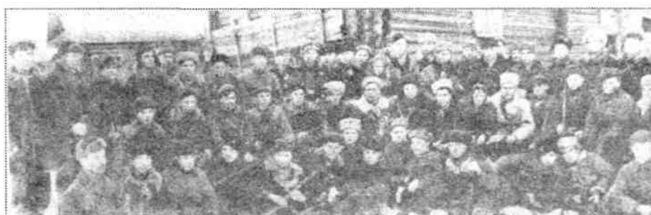
Бойцы 5-й ЛПБ. Деревня Лежню. 1943 г.

Местом приёма выбрали Шкваренскую лесную дачу, а приём грузов был поручен второму полку, как наиболее «отошавшему» по части боеприпасов. Обещанных самолётов полк ждал 6 дней, ЛШПД своё обещание ежедневно подтверждал радиограммами, на подготовленной к приёму грузов площадке каждую ночь дежурили партизаны, но самолёты так и не пришли.