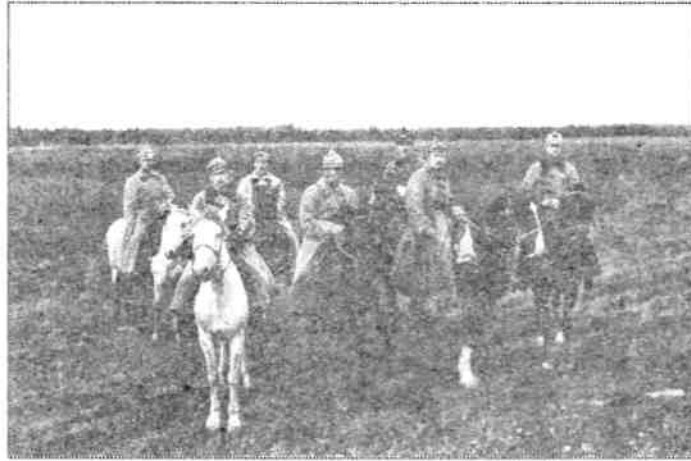
Группа кавалеристов на учениях. Август 1923 года.

тавшем в Красноармейском Лагере почтовом агентстве. В списках военных лагерей за 1935 г. значится «Красноармейский лагерь, пл. Владимирская». Красноармейский Лагерь упоминается и в «Административном справочнике по районам Ленинградской области» за 1936 год. Было ли это попыткой переименования военными пункта своего летнего базирования? Неизвестно. Название платформы Владимирский Лагерь сохранено на военно-топографической карте 1939 г., а вот в сводках Ленинградского штаба партизанского движения времен войны указывается не только станция Владимирский Лагерь, но и платформа Красноармейский лагерь. В 1920-е – 1930-е гг. в летние лагеря по-прежнему прибывали артиллеристы и стрелки. Здесь базировались 101-й Корпусной артиллерийский полк, части 16-й гвардейской стрелковой дивизии, дивизион аэростатов и др. В летних лагерях также проходили военные сборы студенты ленинградских вузов, где были военные кафедры: государственного университета, электротехнического института связи, института точной механики и связи и др. Например, известный советский генетик Иосиф Абрамович Рапопорт (1912-1990), обучавшийся в молодости в ЛГУ, позже вспоминал: «В 1931 г. я был в лагере Струги Красные вместе с моими товарищами, людьми моего возраста, с генетиками и другими, и стал сержантом».