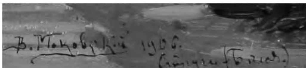
Надпись на картине: «В. Маковский 1906. Струги-Белая)»