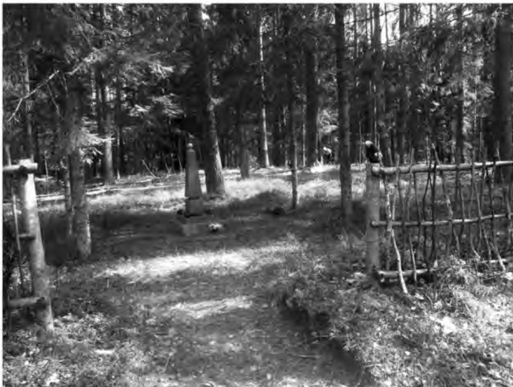
Букинское старообрядческое кладбище. Фото 2016 г.