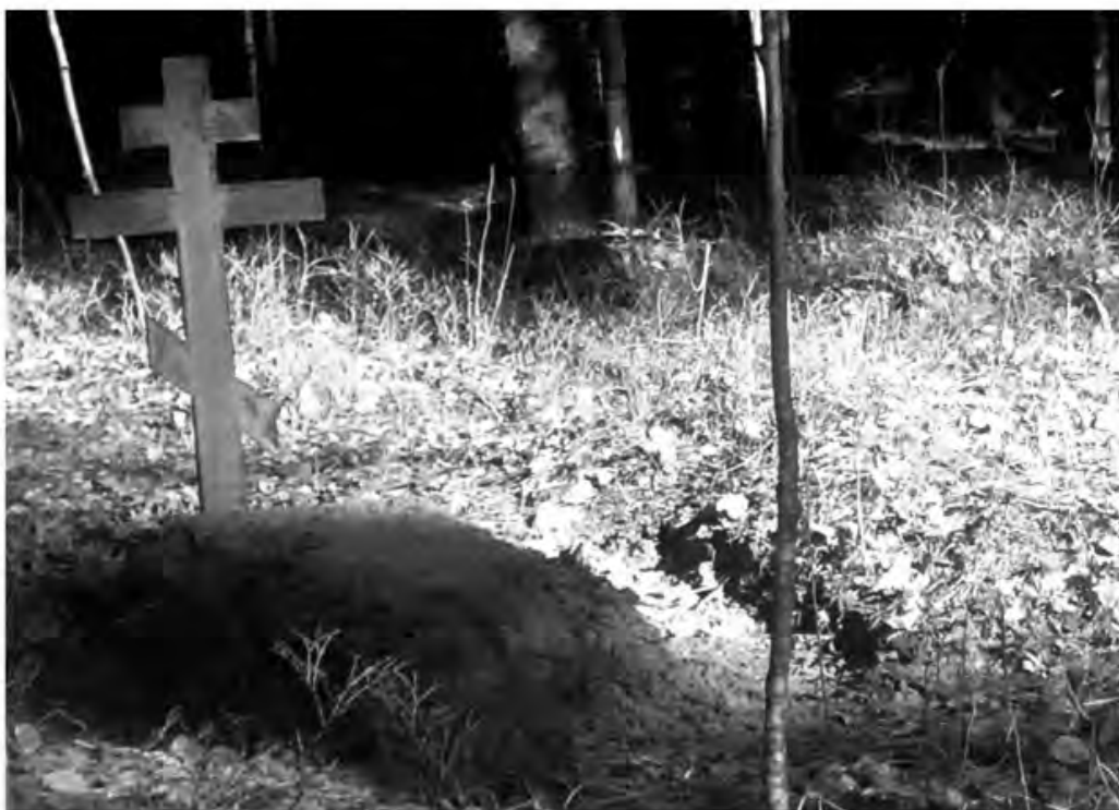
Могила жены Михея Лазаревича Лазарева на Букинском старообрядческом кладбище. Фото 2016 г.