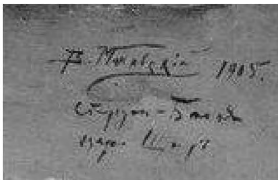
Надпись на портрете И.Е. Цветкова: «В. Маковский 1905. Струги-Белая озеро Щирь»