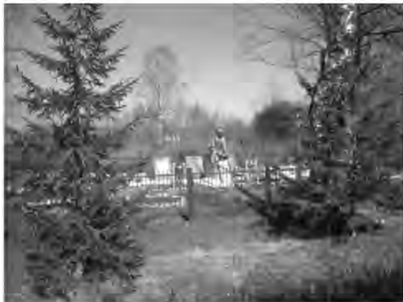
Братская могила в д. Мануйлово Парфинского района