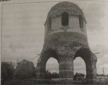
Феофилова пустынь. Современный вид.

Прокофий Нестеров, больше никого не явилось». При этом в монастыре имелось: «Келья строителя с перерубом, сенями и чуланом, четыре братских кельи, трапеза братская с черною печкою, келья хлебная, поварня, квасная, четыре хлебных амбара, из коих три запечатанных с хлебом, в 1738 г. октября 1-го дня, по указу, от подполковника Якова Дурнова, посланным от него капралом Семеном Дятковым».