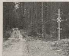
Дорога к месту подвига Мардария

В завершение хочу рассказать вам несколько легенд об иеромонахе Мардарии, которые составил на основе опроса местных жителей и публикаций газет.